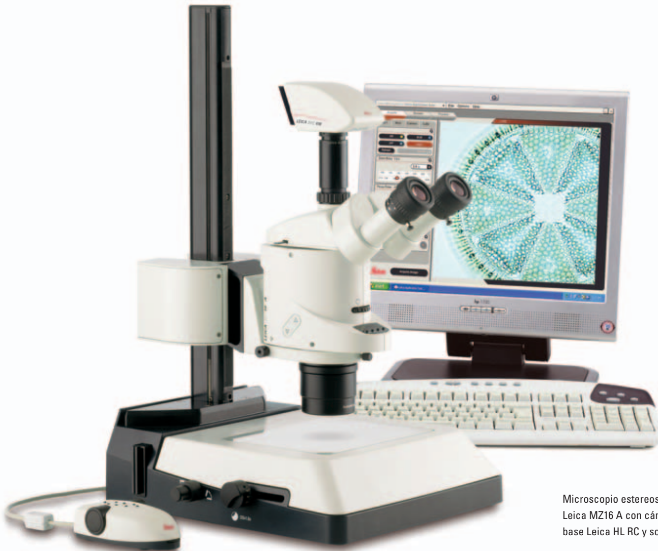
Microscopio estereoscópico automático Leica MZ16 A con cámara digital Leica DFC490, base Leica HL RC y software Leica LAS